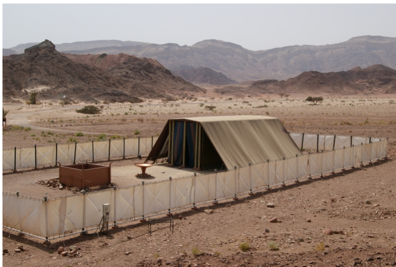
Figure 1: Fullskalemodell av tabernaklet i Timna Park, Israel.

En given plats att börja är tabernaklet, eller uppenbarelsetältet. Det var den helgedom, i form av ett tält med diverse tillbehör, som Israelerna fick i befallning av Gud att tillverka efter att han befriat dem från ett flerhundraårigt slaveri i Egypten. Det finns ganska detaljerade beskrivningar av hur den här helgedomen skulle se ut i andra halvan av andra Mosebok. Jag har dock inte tänkt att läsa något av det, utan istället visa lite bilder hämtade från wikipedia av rekonstruktioner som har gjorts utifrån den bibliska texten.